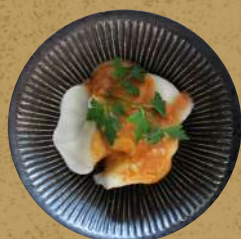
水餃子の芝麻ソースかけ