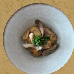
海老のキノコソースかけ