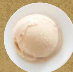
マロンアイスクリーム