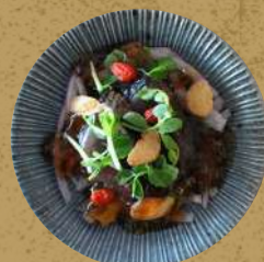
カツオたたきジュレソースかけ